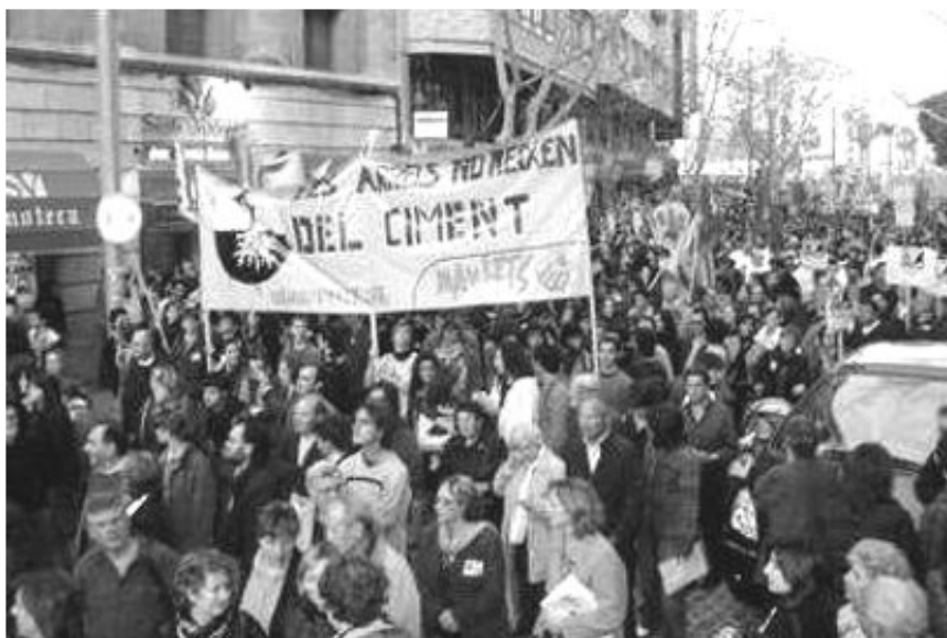
Maulets participà en la manifestació i la campanya "Salvem Mallorca"

afecten el jovent: l'addicció a les noves tecnologies, el desarrelament social, el consum compulsiu o la reproducció acrítica dels discursos imposats són tant preocupants com el consum de drogues. El problema no són ni les consoles, ni els comerços ni l'alcohol, sinó l'ús que se'n fa. Cal debatre profundament les nostres actituds i comportaments en tots els nivells de la nostra vida.