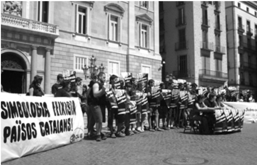
La CAJEL va retirar i lliurar 1000 plaques franquistes en la seva campanya contra la simbologia feixista