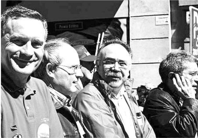
A l'oposició tot eren manifestacions antitransvasistes