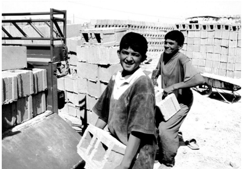
Les deslocalitzacions són possibles mercès a les condicions laborals inhumanes dels països de la perifèria

Ens toca encarir-los-la. Segurament la resposta serà un enrocament en posicions encara més reaccionàries (discursos més liberals, demanda encara més histèrica d'augmentar els instruments repressius, posada en qüestió dels drets de vaga i associació conquerits). Aquest enrocament pot servir com a mínim per esborrar de la imaginació dels treballadors la idea que aquestes organitzacions els representen.