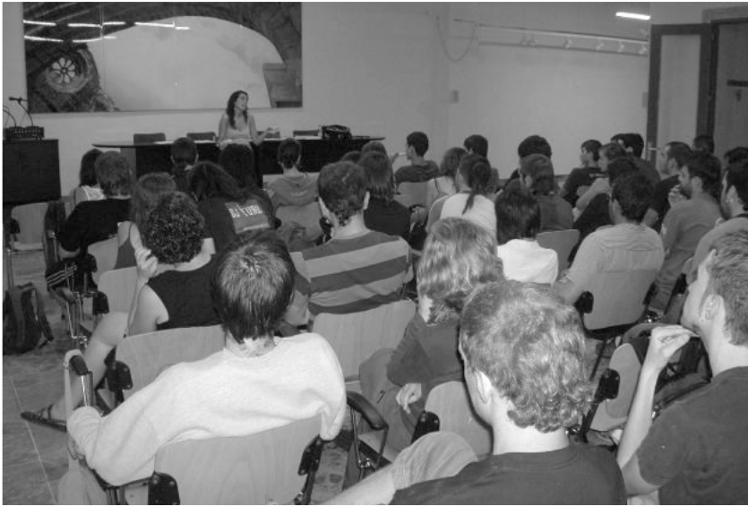
Acte a l'Aplec de l'Esquerra Independentista del Camp

estratègiques i tàctiques molt versemblants. És important no obviar el fet que l'aprovació d'aquestes pautes tàctiques i estratègiques no feien més que evidenciar, reconduir i reforçar una estratègia que des de feia temps ja es reconeixia com a necessària i s'havia aplicat a nivell local i en determinats moments, com les campanyes contra la Constitució Europea, algunes respostes antirepressives o l'establiment conjuntural de marcs de discussió sobre qüestions molt variades. Així doncs, es pot afirmar que la proposta de la CEI, i la seua acceptació per la major part del moviment independentista, no va ser més que la plasmació final d'un funcionament de l'independentisme que es donava de manera real.