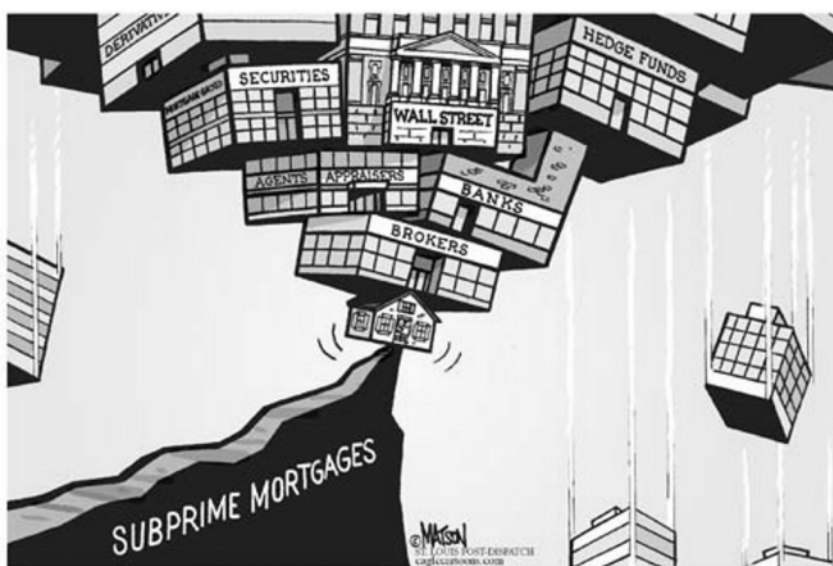
"PENSAVA QUE NOMÉS ESTÀVEM COMPRANT UNA CASA"

La quantitat d'aturades als Països Catalans (dades del País Valencià, Principat de Catalunya i Illes Balears i Pitiüses) durant el mes de juny de 2008 arribà a les 612.216 persones, el 9'3% de la població