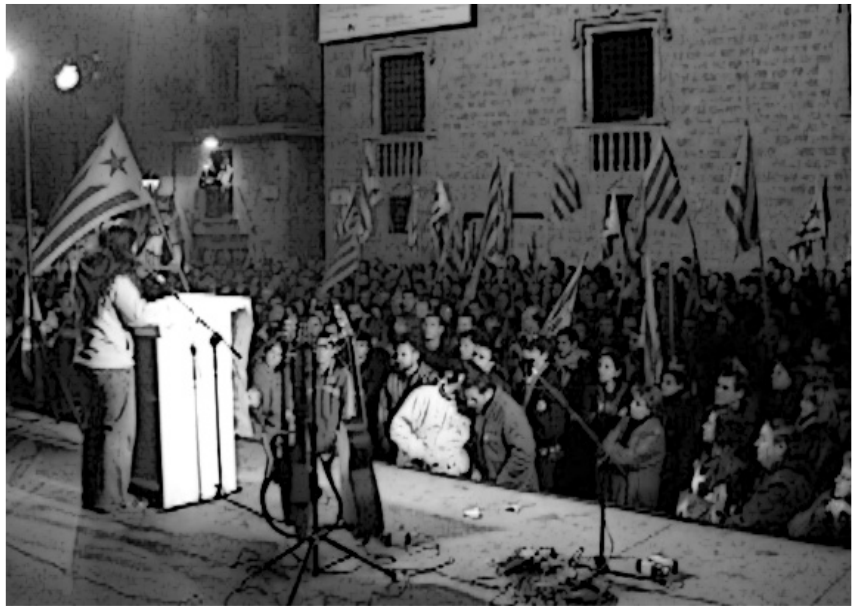
Manifestació de la Campanya Unitària per l'Autodeterminació l'11 de febrer de 2006

En el marc d'aquesta dinàmica hem viscut importants diades de lluita amb una extensió territorial sense precedents arreu dels Països Catalans, mobilitzacions tant importants com les celebrades a Lleida el passat mes d'octubre, o la Diada unitària l'Onze de Setembre. I en aquest context d'unitat d'acció i de reforçament de les eines d'intervenció política pròpies, sent capaços de fer arribar els nostres plantejaments i projecte polític a