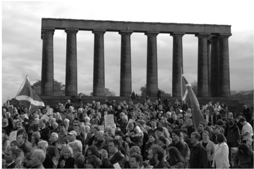
Marxa per una República Escocesa Independent, Edimburg, 2004

Aquest petroli fou descobert als anys seixanta i sempre ha estat regulat i controlat pel govern britànic, fet pel qual als anys setanta l'SNP va iniciar una campanya anomenada " It's Scotland's oil ", reclamant aquest petroli com una ferramenta fonamental per l'economia escocesa